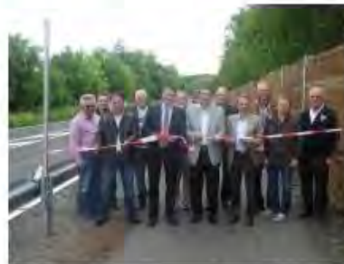
Seit gestern Nachmittag ist der Radweg von Lich nach Eberstadt auch offiziell für den Verkehr freigegeben.

★ Empfehlen (0) Facebook Twitter Google+