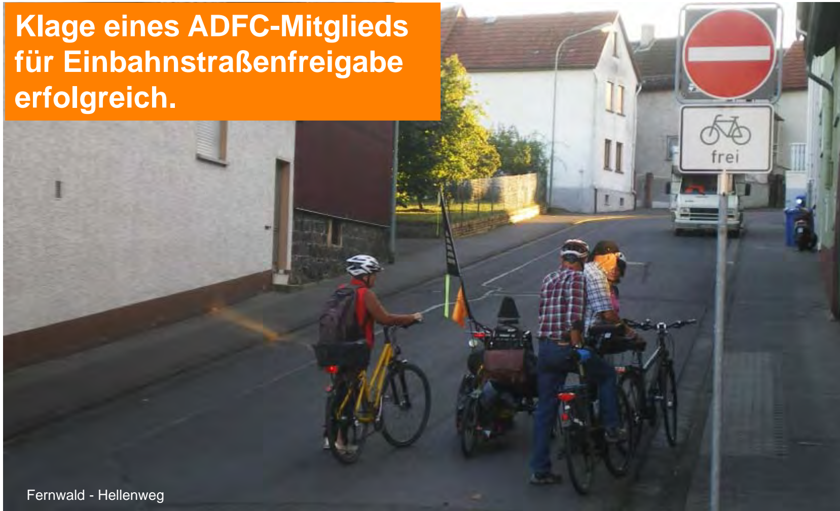
Fernwald - Hellenweg

Klage eines ADFC-Mitglieds für Einbahnstraßenfreigabe erfolgreich.